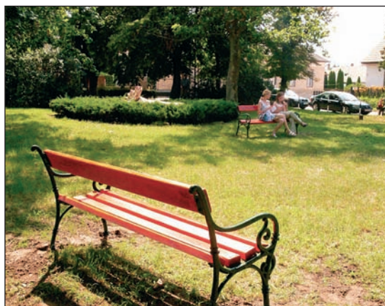
Júliusban összesen 84 padot helyeztek ki