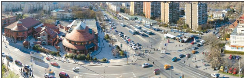
Keresztúr városközpont az egyik fejlesztendő terület

A rákoskeresztúri városközpont megújításához kapcsolódóan Rákosmente városvezetése elkészítette a kerület középtávra, a 2008-2013-as időszakra vonatkozó fejlesztési stratégiáját, az ún. IVS-t (Integrált Városfejlesztési Stratégia). Az eddigi kerületfejlesztési koncepciókhoz képest egyik újdonsága, hogy a kerület egészére vonatkozó demográfiai, környezeti, gazdasági és funkcióelemzésen és az erre épülő stratégián felül a kerületrészeket külön-külön is tartalmaz elemzéseket és fejlesztési terveket. A kerület átfogó céljaként a hiányzó infrastrukturális feltételek pótlását és a növekvő lakosságszámhoz történő alakítását, valamint a minőségi élettér kialakítását jelöli meg a dokumentum, ezeket pedig oly módon kívánja elérni, hogy a megmaradjon Rákosmente kertvárosias, „zöld” hangulata. Ezeket az átfogó célokat fogalmazza meg tömören Rákosmente jelmondata is: „Rákosmente, a modern kertváros”.