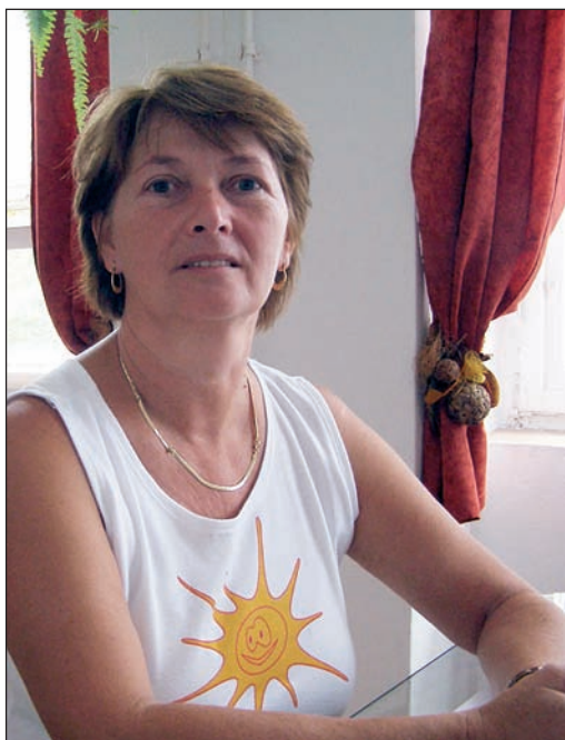
Az óvodás gyerekeknek is szükségük van a sportra

– Ez a kitüntetés mit jelent önnek, dicsőséget, öngigazolást? Mondhatni, hogy az elmúlt harminc év egy tudatos út