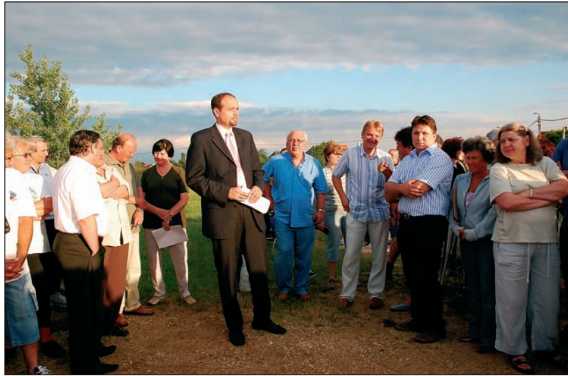
Az elmúlt hetekben több lakossági fórumot is tartottak a nemkívánatos beruházás miatt

Július 16-ra rendkívüli testületi ülést hívott össze Riz Levente polgármester a Madárdomb mellé tervezett borraktár ügyében. Az úgynevezett Flamingó-területen egy borkereskedelemmel foglalkozó cég kezdett építkezésbe, ám ez ellen tiltakoznak a környéken élők. A lakók több fórumot tartottak, civil egyesületet is létrehoztak a helyi érdeket képviselve. A lakók mellé állt Riz Levente polgár-