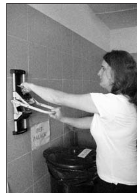
Minden lépcsőház kapott egy műanyagpalackprést

láltak megfelelő szakmai partnert ahhoz, hogy a kerületben akár mindegyik társasházi lakás (több mint 8500) számára biztosítsanak közvetlen szelektív gyűjtést. Az érdeklődőknek azt javasolják, addig is kezdjék el kicsiben, maguktól, amíg a megfelelő tárolóedények és hozzá a szolgáltatás meg nem érkezik.