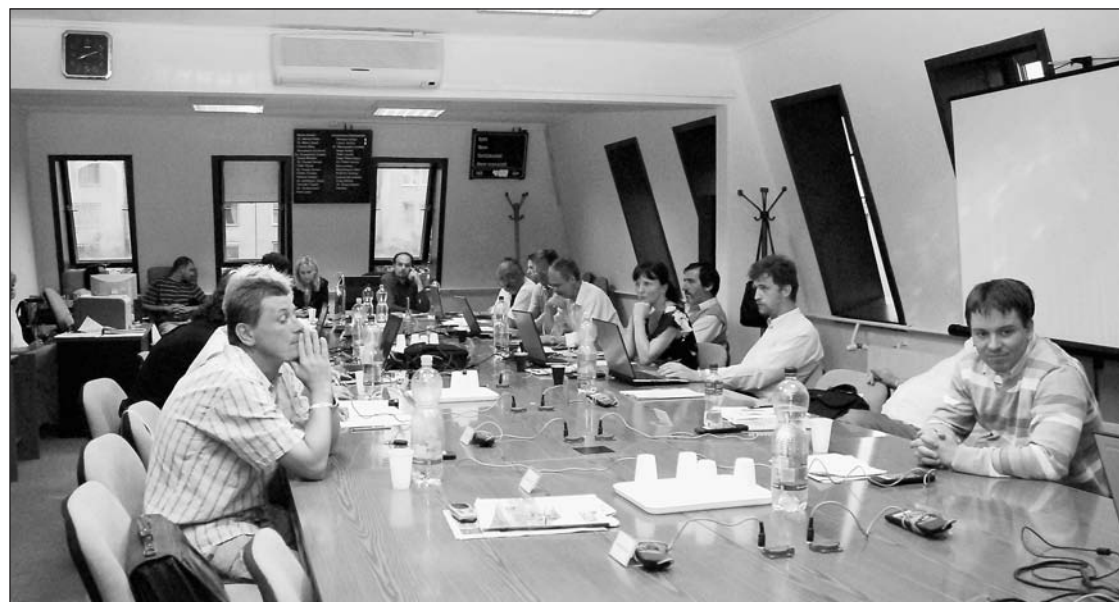
A földutak szilárd burkolattal történő ellátására további 196 millió forintot fordít az önkormányzat

Ismét lesz Autómentes Nap a kerületben. A képviselők Riz Levente polgármester javaslatára úgy döntöttek, hogy a kerület csatlakozik az Európai Mobilitási Hét elnevezésű európai kezdeményezéshez az Európai Autómentes Nap 2008. szeptember 20-án történő megtartásával, valamint a Polgármesteri Hivatal épületénél kerékpártárolók kiépítésével. Az Európai Autómentes Nap megrendezésének költségeire 5,934 millió forintot szavaztak meg. A tavalyi programhoz hasonlóan idén is Ferihegyi út lezárt területén és a rákoshegyi vasútállomáson tartják meg a rendezvényt. A nap este nagyszabású koncerttel végződik, amelynek sztárvendége Charlie lesz.