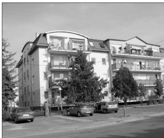
A társasház lakói szelektíven gyűjtik a hulladékot

Ez a lehetőség inspirálta a kerületi Borsó utca 64/c alatti társasház vezetését és lakóit