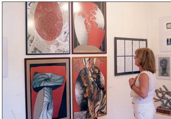
Az idei biennálén öt külföldi művész is részt vett