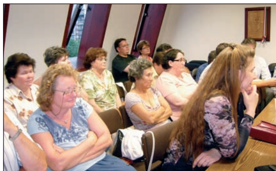
A madárdombiak küldöttsége is részt vett az ülésen

A Borraktár Kft. is kérelmezte az építési engedély meghosszabbítását, amelyet a hatóság engedélyezett 2007. május 9-ig, majd az újabb hosszabbítás iránti kérelmet 2007. május 14-én kelt határozatával megtagadta. Ennek indoklásában szerepelt, hogy a helyi építési szabályzat időközben módosult, amely a beépítési százalék csökkenésével és a zöldfelületi mutató növekedésével járt. A határozat azt is rögzítette, hogy „a Borraktár