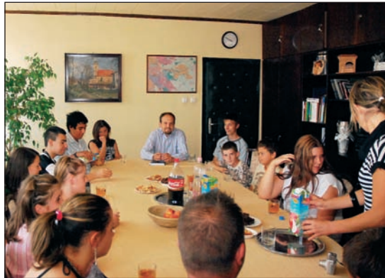
A gyerekek az önkormányzat munkájáról érdeklődtek

A gyerekeket érdekelte, hogy milyen iskolai végzettségre van szüksége egy polgármesternek, kap-e munkaruhát, és mivel tölti szabadidejét, ha van neki. Riz Levente elmondta,