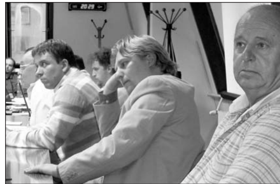
A szocialista frakció

érdekében, hogy az megépítse a szükséges beruházásokat, ez azonban nem valósult meg. Szerinte az építésügyi hatóság korrekten járt el, ugyanakkor az önkormányzatnak okulnia kell a történetekből. Elmondta, hogy támogatja az előterjesztést, mert