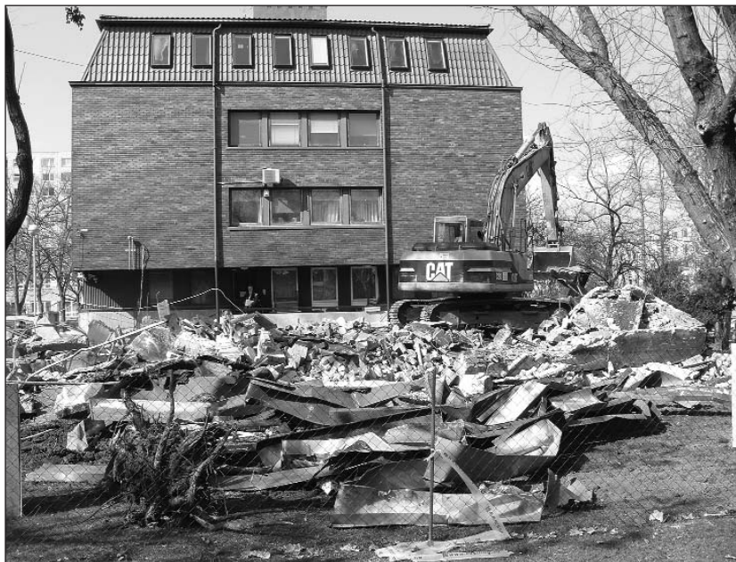
A Polgármesteri Hivatal régi garázsát lebontották, helyén új étterem és irodák épülnek

Március 1-től megszűnt az Egészségház utca és a Pesti út közötti gyalogos átjárás és a kastélykertben tilos a parkolás. Megkezdődött a Polgármesteri Hivatal régi garázsának