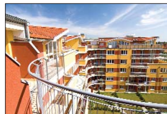
XVIII. kerület, Zaragoza Kert